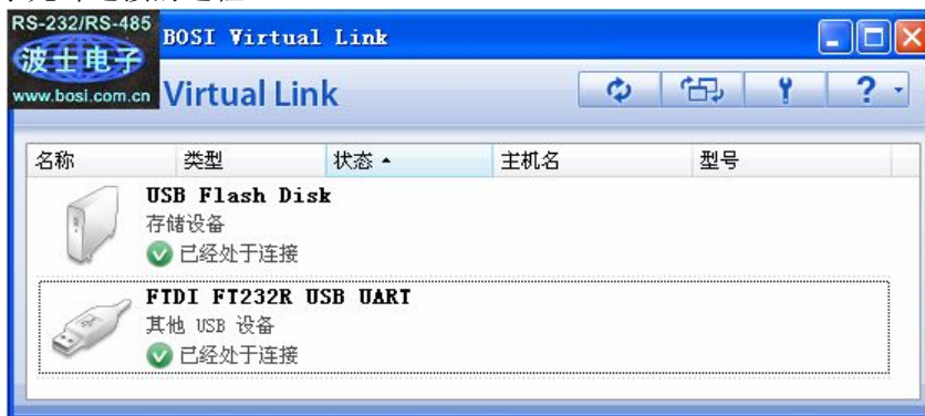
图 2： OPET-USB4 软件设置

使用时将 USB 设备外插到以太网/双 USB 转换器上，比如如果在 USB 插座上分别外插 U 盘和 USB-串口转换器，在计算机上运行配套的软件“Virtual Link”会自动显示已经连接 U 盘和 USB-串口(如图 2 左)，并且会自动查找和安装驱动程序，直到成功连接。然后打开计算机的“资源管理器”就可以读写这个 U 盘了，打开计算机的“设备管理器”就可以看到这个 USB 虚拟串口了。这样就实现了光纤连接的远程 USB 口。