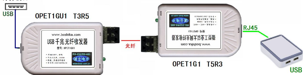
图 3： 使用单纤的 OPET-USB41 全套产品